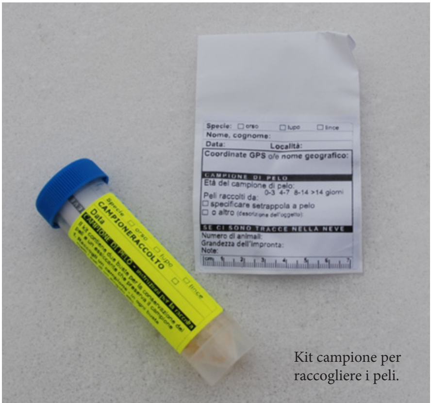
Kit campione per raccogliere i peli.

I follicoli dei peli forniscono una buona fonte di DNA. Analogamente ad altri campioni genetici non invasivi, il DNA nei campioni di peli si degraderà nell'ambiente e la probabilità che l'analisi abbia esito positivo diminuisce nel tempo. Tuttavia, a differenza dei campioni di escrementi non si conservano bene e dovrebbero essere trasferiti in un laboratorio per l'analisi il più presto possibile.