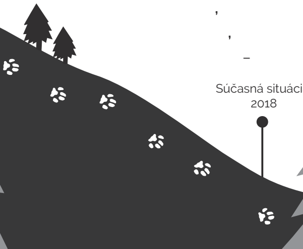
Súčasná situácia 2018

Rys je symbol Dinárskeho Pohoria, rovnako ako je lev symbol Afriky.